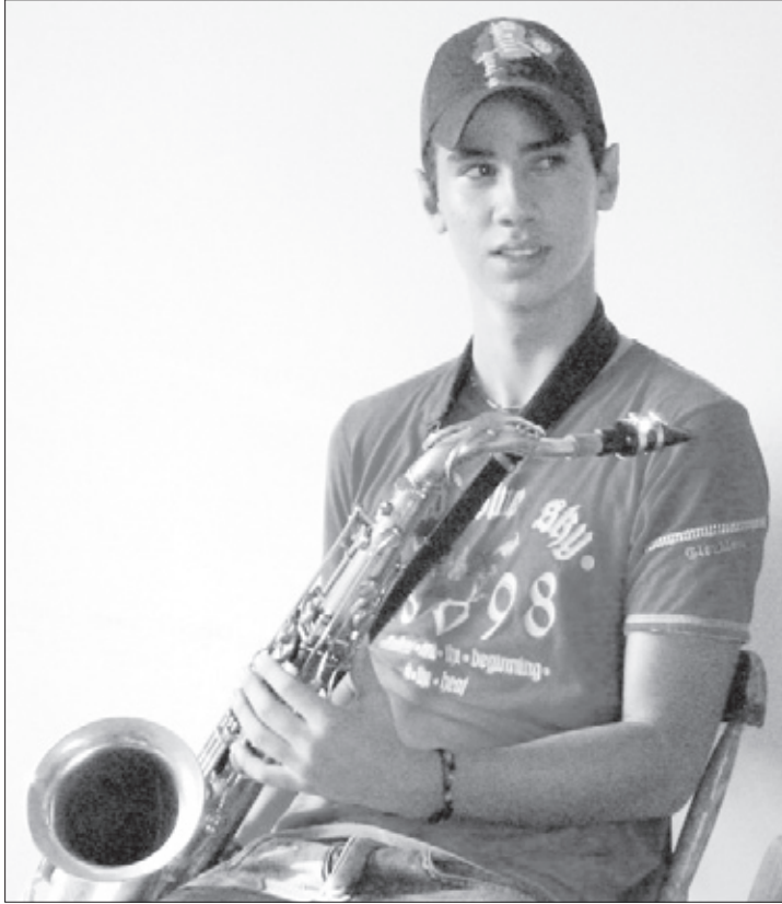
Projeto atende dezenas de estudantes de baixa renda

Hoje, às 20h, a Fundação Cultural fará o lançamento oficial do Projeto Clave de Luz na Escola Municipal de Música Luzia Guina Machado. Criado no ano passado, o projeto oferece formação musical profissional a dezenas de estudantes de baixa renda. O destaque da noite será o show da Orquestra de Sopros Paranaíba. A entrada é gratuita. Em 2009, a Fundação Cultural criou o Projeto Clave de Luz com o objetivo de dar uma nova oportunidade de formação a dezenas de adolescentes sem condições financeiras para estudar música.